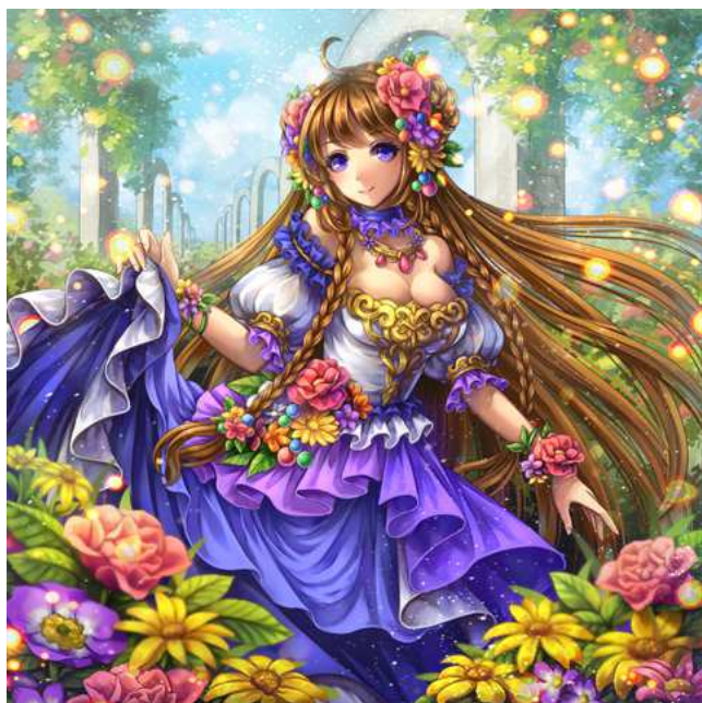
4周年特別モンスター「クローリス」

2015年3月9日 株式会社さくらソフト ( http://www.sakurasoft.co.jp/ )